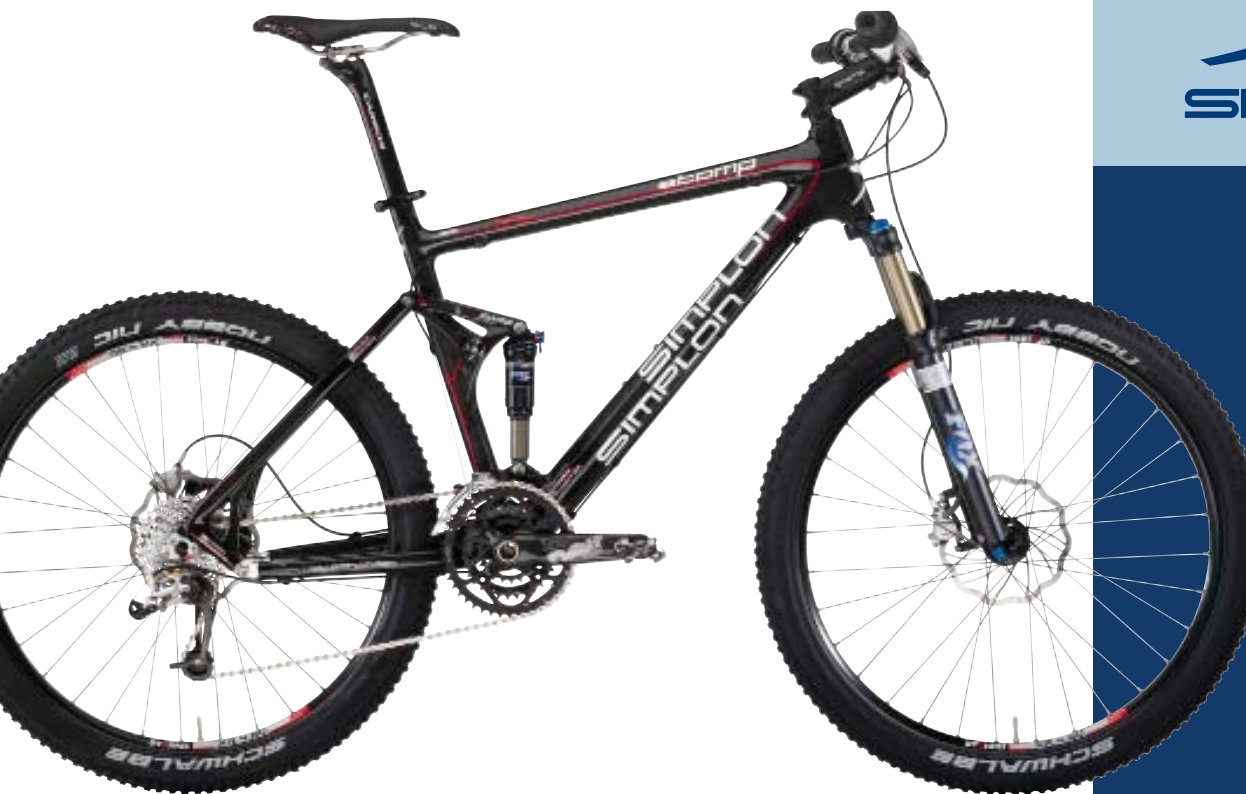
Abb: STOMP TRA

Das neue Carbon-Wunderwerk Simplon STOMP ...“