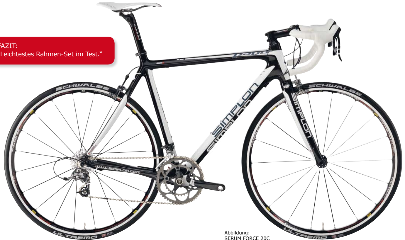
Abbildung: SERUM FORCE 20C

FAZIT: „Leichtestes Rahmen-Set im Test.“